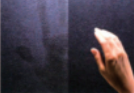
特殊製法による指紋が目立たない天板