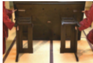
③天板裏のサンを脚の固定用枠に収めます。グラツいたり金具が壊れる心配がないのはこの構造の為です。