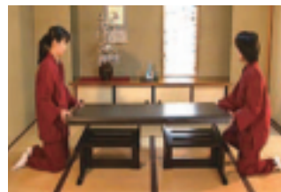
①座卓の天板を二人で持ち上げます。