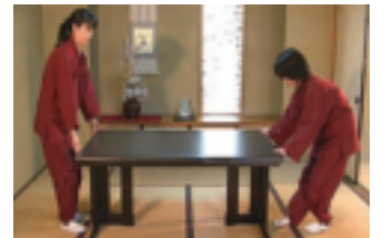
④天板を元に戻して、洋スタイルの完成。