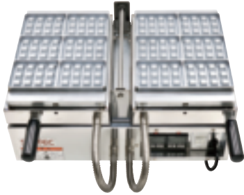
※写真はワッフル長角形です。