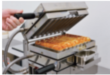
生地をプレートに入れて「はさまみ焼き」するだけ