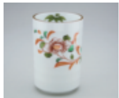
⑲ KY6-19 錦草花長湯呑(大) [SMTT-H2] 納直 11-1027-1901 ¥960 サイズ:φ68×H102 230cc