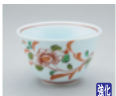
㉖ KY6-26 赤絵草花反干茶 [SMTT-H9] 納直 11-1027-2601 ¥780 サイズ:φ92×H57 160cc