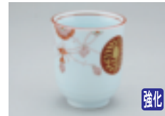
⑤ KY6-05 錦瓔珞長湯呑 [SMTT-F8] 納直 11-1027-0501 ¥900 サイズ:φ67×H82 170cc