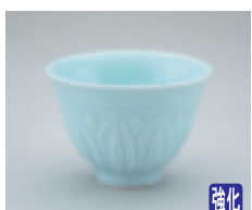
㉜ KY6-32 青白彫干茶 [SMTT-I5] 納直 11-1027-3201 ¥800 サイズ:φ83×H59 130cc