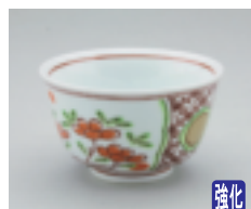
㉘ KY6-28 金丸紋反干茶 [SMTT-I1] 納直 11-1027-2801 ¥1,360 サイズ:φ90×H53 160cc