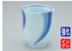
④ KY6-04 ネジ十草長湯呑 [SMTT-F7] 納直 11-1027-0401 ¥860 サイズ:φ67×H82 170cc