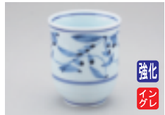
① KY6-01 染付唐草長湯呑 [SMTT-F4] 納直 11-1027-0101 ¥940 サイズ:φ67×H82 170cc

美濃焼（日本製）湯呑・干茶 強化 このマークは強化磁器商品です。 強化 このマークは洗浄機でとれない加色方法の商品です。