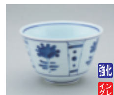
㉙ KY6-29 染付間取反干茶 [SMTT-I2] 納直 11-1027-2901 ¥1,140 サイズ:φ92×H57 160cc