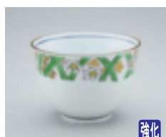
㉝ KY6-33 水仙画干茶 [SMTT-I6] 納直 11-1027-3301 ¥820 サイズ:φ81×H57 150cc