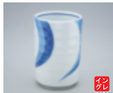
㉑ KY6-21 ネジ十草長湯呑(大) [SMTT-H4] 納直 11-1027-2101 ¥1,060 サイズ:φ68×H102 230cc