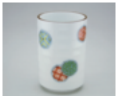
⑳ KY6-20 錦丸紋長湯呑(大) [SMTT-H3] 納直 11-1027-2001 ¥1,140 サイズ:φ68×H102 230cc