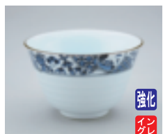
㉕ KY6-25 山水反干茶 [SMTT-H8] 納直 11-1027-2501 ¥840 サイズ:φ92×H57 160cc