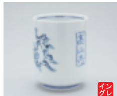
⑮ KY6-15 高山寺大湯呑 [SMTT-G8] 納直 11-1027-1501 ¥980 サイズ:φ71×H90 230cc