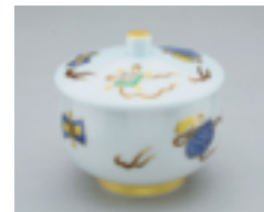
㉔ KY6-24 宝尽くし蓋付干茶 [SMTT-H7] 納直 11-1027-2401 ¥2,200 サイズ:φ82×H83 180cc