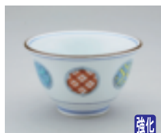
㉗ KY6-27 丸紋反干茶 [SMTT-I0] 納直 11-1027-2701 ¥1,300 サイズ:φ92×H56 160cc