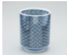
⑯ KY6-16 京祥瑞切立湯呑 [SMTT-G9] 納直 11-1027-1601 ¥720 サイズ:φ67×H84 200cc