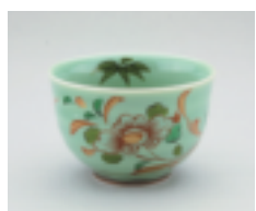
㉛ KY6-31 赤絵草花干茶 [SMTT-I4] 納直 11-1027-3101 ¥940 サイズ:φ85×H56 160cc