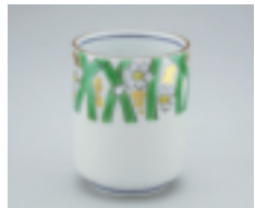
⑬ KY6-13 水仙画切立湯呑 [SMTT-G6] 納直 11-1027-1301 ¥760 サイズ:φ67×H84 200cc