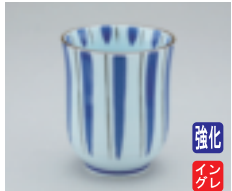
⑧ KY6-08 太十草長湯呑 [SMTT-G1] 納直 11-1027-0801 ¥1,440 サイズ:φ67×H82 170cc