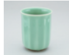
⑫ KY6-12 天竜青磁削ぎ湯呑 [SMTT-G5] 納直 11-1027-1201 ¥560 サイズ:φ66×H82 150cc