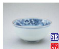
㉟ KY6-35 内山水丸干茶 [SMTT-I8] 納直 11-1027-3501 ¥1,620 サイズ:φ93×H47 150cc