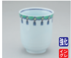
⑦ KY6-07 緑瓔珞長湯呑 [SMTT-G0] 納直 11-1027-0701 ¥720 サイズ:φ67×H82 170cc