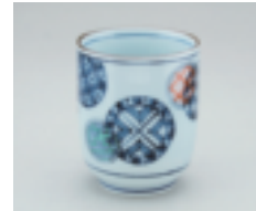
⑪ KY6-11 染錦丸紋湯呑 [SMTT-G4] 納直 11-1027-1101 ¥800 サイズ:φ66×H82 180cc