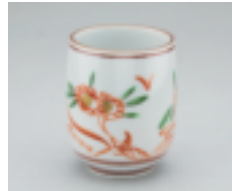
⑩ KY6-10 赤絵樽型湯呑 [SMTT-G3] 納直 11-1027-1001 ¥1,420 サイズ:φ62×H82 180cc