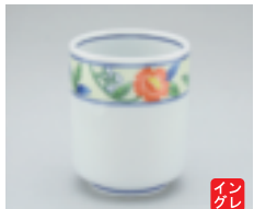
⑭ KY6-14 錦草花切立湯呑 [SMTT-G7] 納直 11-1027-1401 ¥700 サイズ:φ67×H84 200cc