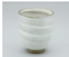
㉒ KY6-22 粉引長湯呑 [SMTT-H5] 納直 11-1027-2201 ¥1,100 サイズ:φ73×H83 180cc