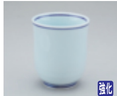
⑨ KY6-09 呉須線長湯呑 [SMTT-G2] 納直 11-1027-0901 ¥720 サイズ:φ67×H82 170cc