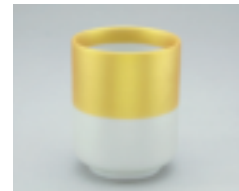
⑱ KY6-18 金銀彩切立湯呑 [SMTT-H1] 納直 11-1027-1801 ¥980 サイズ:φ67×H84 200cc