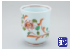
② KY6-02 錦草花長湯呑 [SMTT-F5] 納直 11-1027-0201 ¥780 サイズ:φ67×H82 170cc