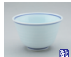
㉚ KY6-30 呉須線反干茶 [SMTT-I3] 納直 11-1027-3001 ¥740 サイズ:φ92×H57 160cc