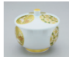
㉓ KY6-23 金彩丸紋蓋付干茶 [SMTT-H6] 納直 11-1027-2301 ¥1,940 サイズ:φ82×H83 180cc