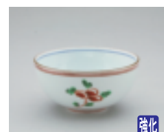
㊿ KY6-36 一ツ花丸干茶 [SMTT-I9] 納直 11-1027-3601 ¥1,540 サイズ:φ91×H46 150cc