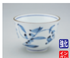
㉞ KY6-34 染付唐草干茶 [SMTT-I7] 納直 11-1027-3401 ¥900 サイズ:φ81×H57 150cc